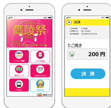
スマホアプリ決済画面